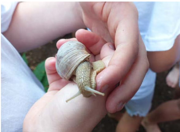
Ausgezeichnete Naturerfahrung bietet der Naturpark dieses Jahr mit Herbstcamps

Weitere Fragen beantwortet Robin Marwege unter der Telefonnummer 04171 693-9786. Per Mail ist er unter robin.marwege@naturpark-lueneburger-heide.de erreichbar. Das Anmeldeformular und alle Infos gibt es auf der Website www.naturpark-sommercamp.de . Der Eigenanteil für die Campwoche inklusive Unterbringung und Vollverpflegung beträgt 150 Euro. Ermöglicht wird das Angebot durch die Förderung der Initiative „Mitten drin! - Jung und aktiv in Niedersachsen“ und der Stadtwerke Buchholz.