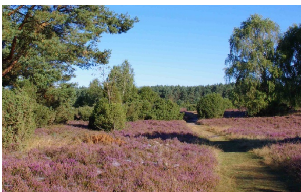
Heidelandschaft mit Spinnenweben